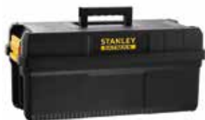
Caixa 25" IP54 e pega ergonómica