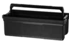
Bandeja profunda com pega Os fechos laterais seguram a caixa acima do elevador