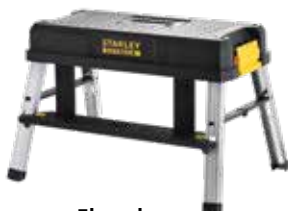
Elevador 150kg de capacidade máxima