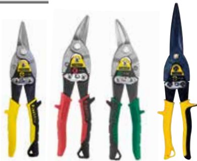
Corte reto Corte esquerda Corte derecha Corte longo